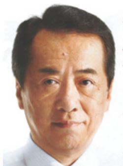
菅 直人 代表

景気が落ち込みデフレ経済が続くなか、国民の暮らし、国政を預かる責任者を決める民主党代表選が行われました。菅直人新代表が誕生！新代表には強いリーダーシップのもとで日本経済を再生する重い責任があります。