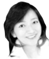
参議院議員 牧山ひろえ